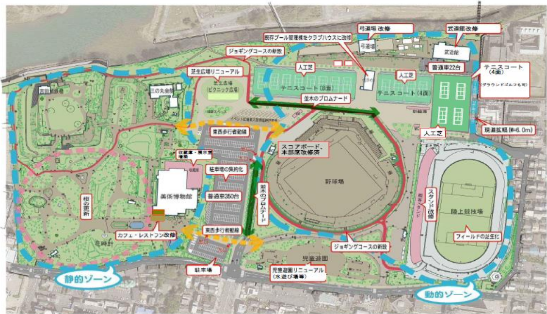
H27.12.22 豊橋公園整備計画図（案）

なお今回の事業提案の内容により、公園の整備計画を一部変更することを予定しています。